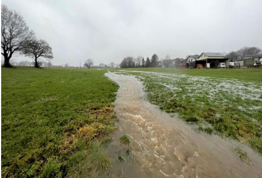
Bild 14: Schleckheimer Bach mit natürlich überschwemmten Wiesenflächen