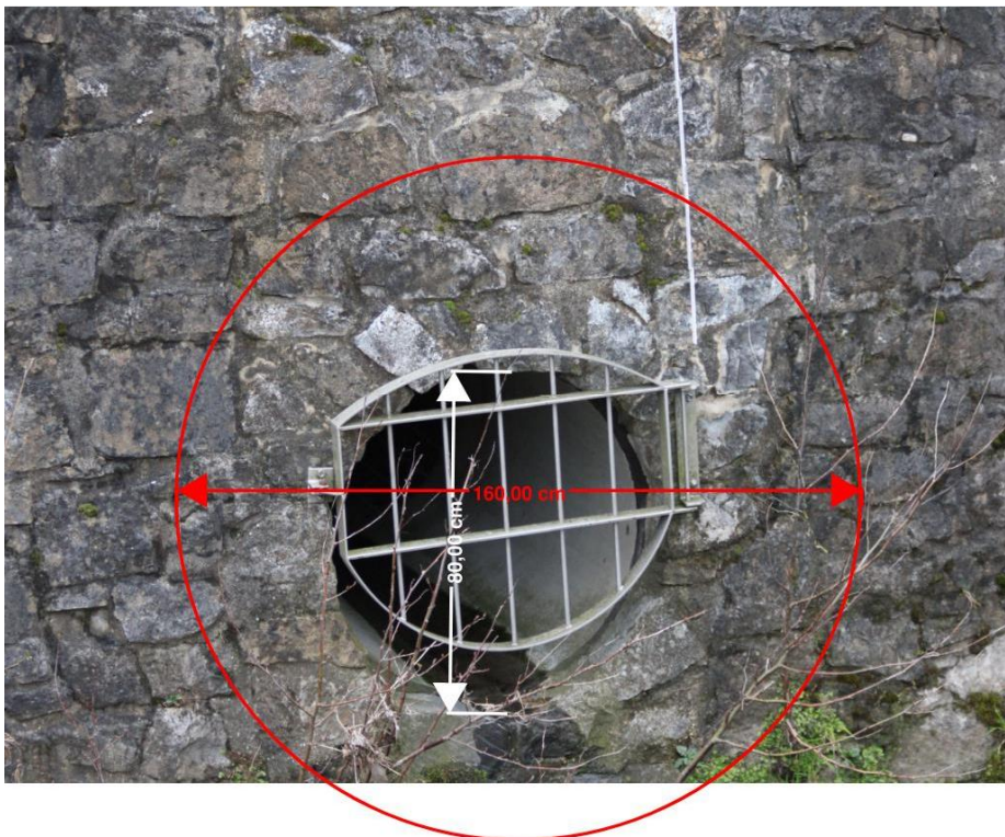
Bild 15: Kanalauslass; Querschnitt von 160 cm vor dem Auslass auf 80 cm reduziert; Lage in Bild 12; gemäß Legende (1) in Höhe Abteigarten / vor der Grundschule