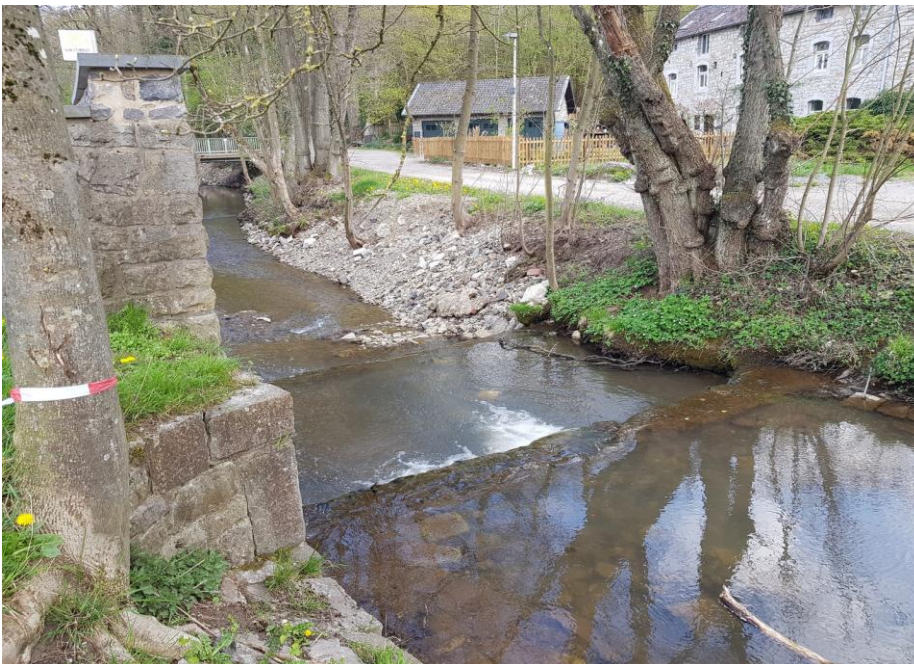
Räumung der Bachsohlen von Großschotter hier Inde/Ortslage AC-Hahn. Negativer Effekt: Zerstörung Bachhabitate, Gefährdung Fischfauna, Erhöhung Strömungsgeschwindigkeit, Zerstörung Ufervegetation, Gefährdung des Baumbestandes am Ufer, Destabilisierung der Ufer, Erhöhung Schadensrisiko durch Hochwasser. Verursacher: Wasserverband Eifel Rur