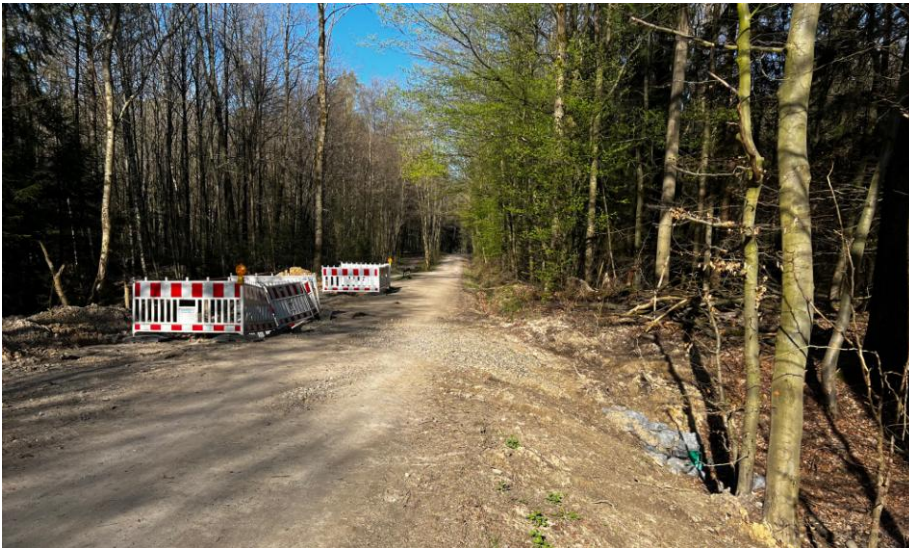
Bild 10: Einbau von Abflussleitungen ; für den Hochwasserschutz negativ. Der Wald sollte als natürliches „Regenrückhaltebecken bei Hochwasser“ dienen.