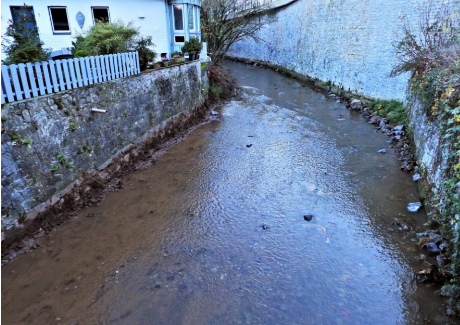
Einebnung der Bachsohle in den Ortschaften , hier Inde/Ortslage Kornelimünster. Negativer Effekt: Zerstörung Bachhabitate, Gefährdung Fischfauna, Erhöhung Strömungsgeschwindigkeit, Erhöhung Schadensrisiko durch Hochwasser. Verursacher: Wasserverband Eifel Rur